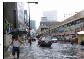
平成25年8月大阪市梅田駅周辺での浸水