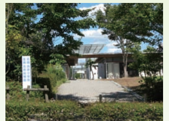
吉備高原小学校・幼稚園