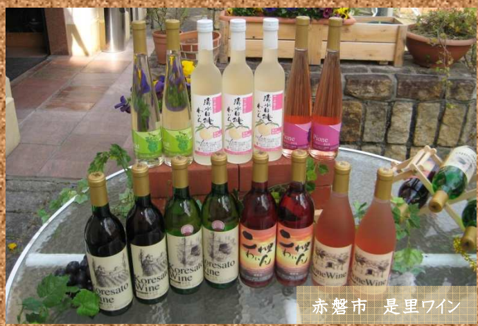
赤磐市 是里ワイン