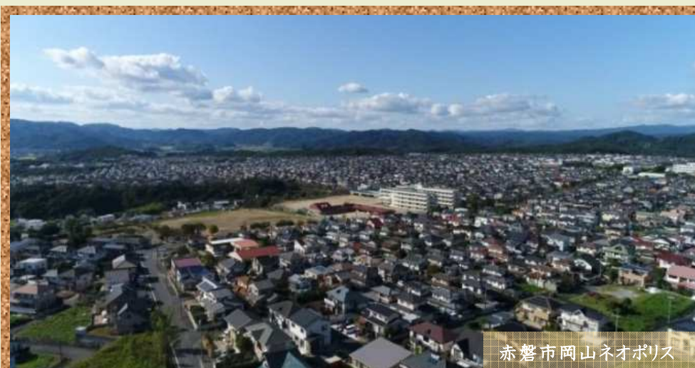
赤磐市 岡山ネオポリス